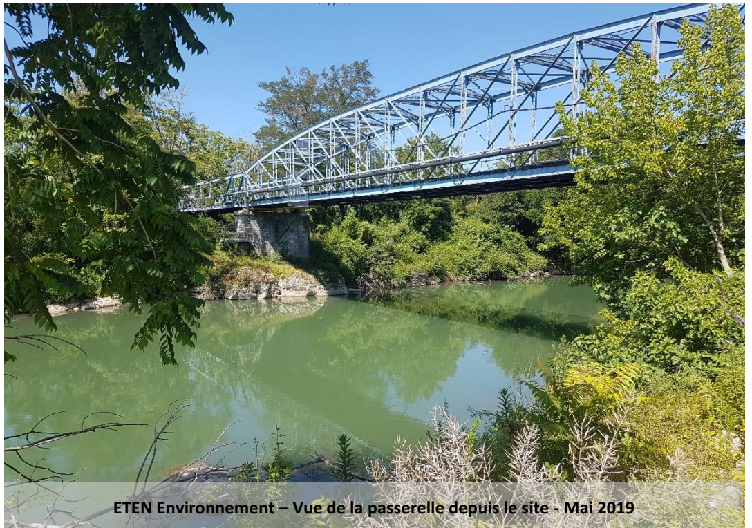
ETEN Environnement – Vue de la passerelle depuis le site - Mai 2019

NOTE DE PRÉSENTATION NON TECHNIQUE DU PERMIS D'AMÉNAGER SOUMIS À ÉVALUATION ENVIRONNEMENTALE ET OBJET DE L'ENQUÊTE PUBLIQUE