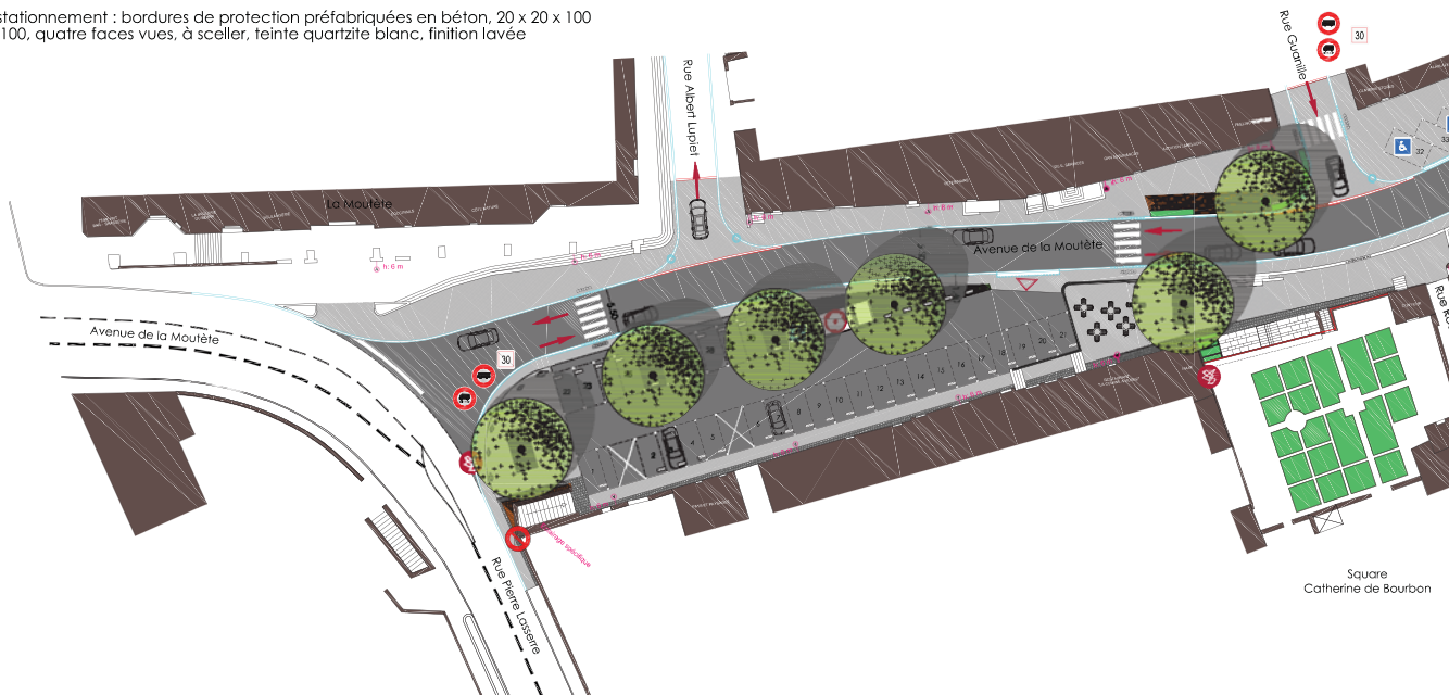
Square Catherine de Bourbon