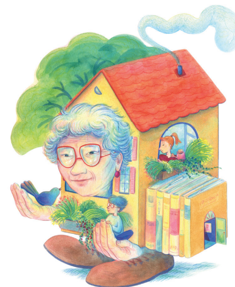
Illustration : Céline Guiné